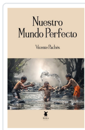
NUESTRO MUNDO PERFECTO VICENTE PACHÉS MARTINEZ