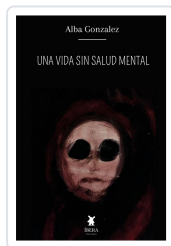
UNA VIDA SIN SALUD MENTAL ALBA GONZALEZ