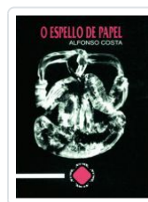
O ESPELLO DE PAPEL ALFONSO COSTA