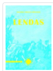
LENDAS GUSTAVO ADOLFO BECQUER