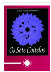
OS SETE COITELAS XOSE AGRELO HERMO