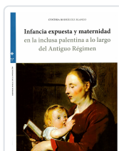
INFANCIA EXPUESTA Y MATERNIDAD EN LA INCLUSA PALENTINA A LO LARGO DEL ANTIGUO RÉGIMEN. CYNTHIA RODRÍGUEZ BLANCO