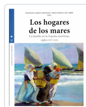
LOS HOGARES DE LOS MARES FRANCISCO GARCÍA GONZÁLEZ, PABLO ORTEGA DEL CERRO (EDS.)