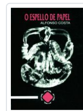
O ESPELLO DE PAPEL ALFONSO COSTA