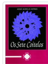
OS SETE COITELOS XOSE AGRELO HERMO