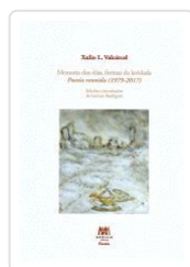
T.DURA.MEMORIA DOS DIAS.FORMAS DA LEVIDADE XULIO L.VALCARCEL