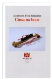
CINSA NA BOCA MONTSERRAT YOLDI SANMARTIN