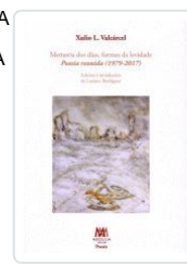
MEMORIA DOS DIAS.FORMAS DA LEVIDADE.(T.BLANDA) XULIO L.VALCARCEL