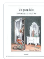
UN PESADELO NO MEU ARMARIO MAYER, MERCER