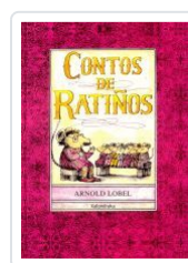
CONTOS DE RATINOS ARNOLD LOBEL