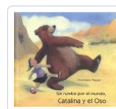
CATALINA Y EL OSO, SIN RUMBO POR EL MUNDO PIEPER, CHRISTIANE