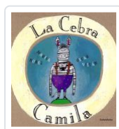
LA CEBRA CAMILA(26º EDICION) MARISA NUNEZ, OSCAR VILLAN(ILU.)