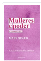
MULLERES E PODER MARY BEARD