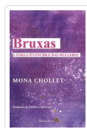
BRUXAS . A FORZA INVENCIBLE DAS MULLERES MONA CHOLLET