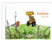
ANIMAIS SECHU SENDE