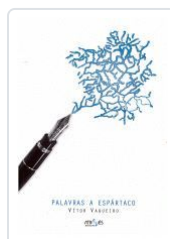
PALAVRAS A ESPARTACO VITOR VAQUEIRO