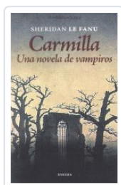
16.CARMILLA.UNA NOVELA DE VAMPIROS SHERIDAN LE FANU