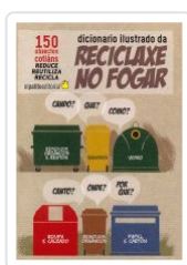
DICIONARIO ILUSTRADO DE RECICLAXE NO FOGAR GEMMA SESAR