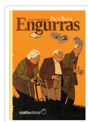
ENGURRAS. (5ªED.) PACO ROCA