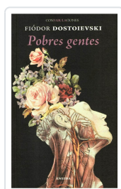
POBRES GENTES FIÓDOR DOSTOIEVSKI