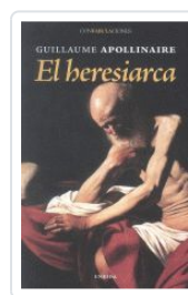
17. EL HERESIARCA GUILLAUME APOLLINAIRE