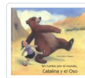
CATALINA Y EL OSO, SIN RUMBO POR EL MUNDO PIEPER, CHRISTIANE