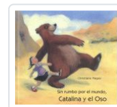
CATALINA Y EL OSO, SIN RUMBO POR EL MUNDO PIEPER, CHRISTIANE