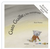
GATO GUILLE Y LOS MONSTRUOS MARTINEZ PEREZ, ROCIO