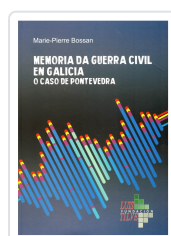
MEMORIA DA GUERRA CIVIL EN GALICIA MARIE-PIERRE BOSSAN