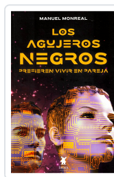
LOS AGUJEROS NEGROS PREFIEREN VIVIR EN PAREJA MANUEL MONREAL