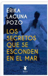
LOS SECRETOS QUE SE ESCONDEN EN EL MAR ERIKA LAGUNA POZO