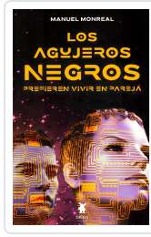
LOS AGUJEROS NEGROS PREFIEREN VIVIR EN PAREJA MANUEL MONREAL