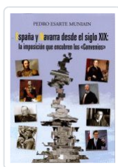
ESPAÑA Y NAVARRA DESDE EL SIGLO XIX: LA IMPOSICIÓN QUE ... PEDRO ESARTE MUNIAIN