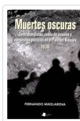
MUERTES OSCURAS. CONTRABANDISTAS, REDES DE EVASIÓN Y ... FERNANDO MIKELARENA