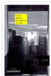
O SOL DENTRO DA CABEZA SUSO DIAZ