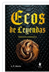
ECOS DE LEYENDAS J. P. MARÍN