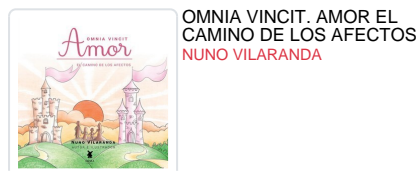
OMNIA VINCIT. AMOR EL CAMINO DE LOS AFECTOS NUNO VILARANDA