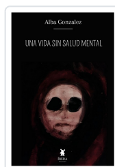
UNA VIDA SIN SALUD MENTAL ALBA GONZALEZ