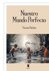
NUESTRO MUNDO PERFECTO VICENTE PACHÉS MARTINEZ