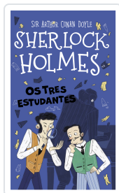
SHERLOCK HOLMES. OS TRES ESTUDANTES SIR ARTHUR CONAN DOYLE; STEPHANIE BAUDET