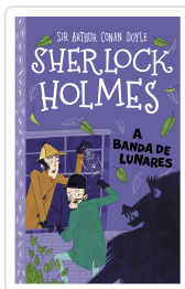
SHERLOCK HOLMES. A BANDA DE LUNARES SIR ARTHUR CONAN DOYLE; STEPHANIE BAUDET