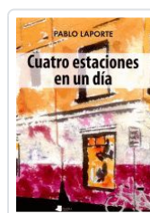
CUATRO ESTACIONES EN UN DÍA PABLO LAPORTE