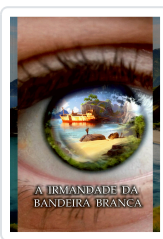
A IRMANDADE DA BANDEIRA BRANCA ANXO MUIÑOS