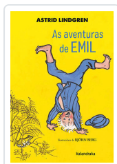
AS AVENTURAS DE EMIL ASTRID LINDGREN