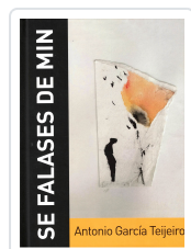
SE FALASES DE MIN (INCL.CD) ANTONIO GARCÍA TEJEIRO