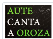
AUTE CANTA A OROZA . (LIBRO/CD) Carlos Oroza ; Luis Eduardo Aute