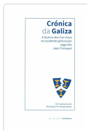
CRÓNICA DA GALIZA JEAN FROISSART