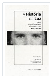
A HISTÓRIA DA LUZ ANTOM SANTOS