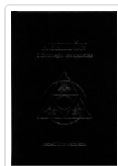
ABELLON. O LIBRO NEGRO DAS ZOADEIRAS XOÁN-XIL LOPEZ; MAURO SANÍN