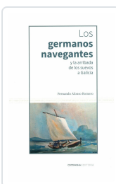
LOS GERMANOS NAVEGANTES Y LA ARRIBADA DE LOS SUEVOS EN GALICIA FERNANDO ALONSO ROMERO