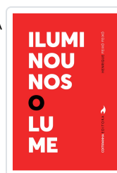
ILUMINOUNOS O LUME HENRIQUE FEIXÓ FEIXÓ