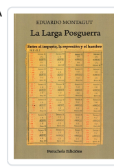
LA LARGA POSGUERRA EDUARDO MONTAGUT