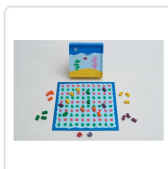
O ARRECIFE (+ 8 ANOS / 4 PERSOAS) BRAZOLINDA