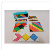
XEOMETRÍAS (+3 ANOS/ + ANOS) BRAZOLINDA