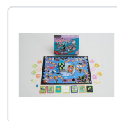
A NOITE DO MEIGALLO (+ 3 ANOS CON AXUDAS; +7 ANOS SEN ELA SE SE SABE LER) BRAZOLINDA