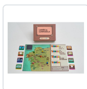
CAMIÑO DE COMPOSTELA (+10 ANOS / 5 PERSOAS) BRAZOLINDA