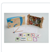
O ESPELLO (+5 ANOS/ 2 PERSOAS) BRAZOLINDA