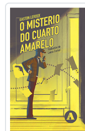
O MISTERIO DO CUARTO AMARELO LEROUX, GASTON