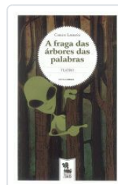
A FRAGA DAS ARBORES DAS PALABRAS CARLOS LABRAÑA