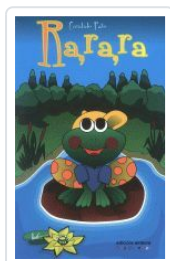
RA, RA, RA (CANDIDO PAZO) CANDIDO PAZO