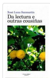
DA LECTURA E OUTRAS COUSIÑAS XOSE LUNA SANMARTIN