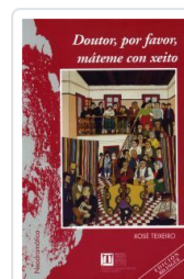
58.DOUTOR,POR FAVOR,MATEME CON XEITO XOSE TEIXEIRO