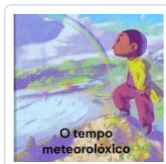
O TEMPO METEOROLOXICO A MESA; MIGUEL ROBLEDO (ILU.)