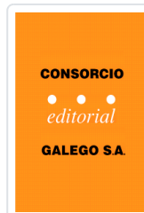
TOPICOS SOBRE A LINGUA GALEGA SUSO FERNANDEZ ACEVEDO