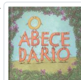
O ABECEDARIO VV.AA.