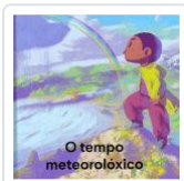
O TEMPO METEOROLOXICO A MESA; MIGUEL ROBLEDO (ILU.)