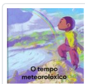
O TEMPO METEOROLOXICO A MESA;MIGUEL ROBLEDO(ILU.)