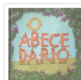
O ABECEDARIO VV.AA.