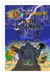
A NOITE DE SAMAIN (OS BARBANZONS) PEPE CARREIRO