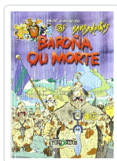
BAROÑA OU MORTE (OS BARBANZONS) PEPE CARREIRO