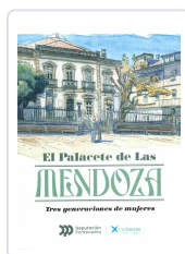
EL PALACETE DE LAS MENDOZA DIEGO PIAY AUGUSTO GEMMA SESA