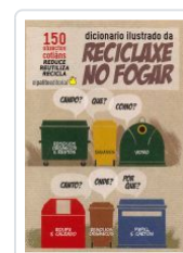
DICIONARIO ILUSTRADO DE RECICLAXE NO FOGAR GEMMA SESAR