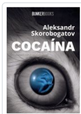
COCAÍNA ALEKSANDR SKOROBOGATOV