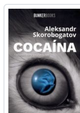
COCAÍNA ALEKSANDR SKOROBOGATOV