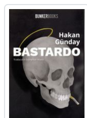
BASTARDO HAKAN GUNDAY