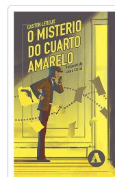
O MISTERIO DO CUARTO AMARELO LEROUX, GASTON