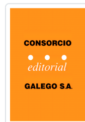
BOAS NOITES,CORUÑA VV.AA.