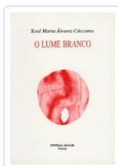
2.LUME BRANCO (POESIA) XOSE MARIA ALVAREZ CACCAMO