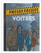
PRESAS FÁCILES. VOITRES MIGUELANXO PRADO