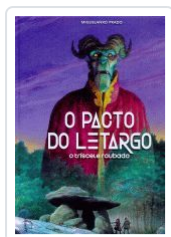
O PACTO DO LETARGO MIGUEL ANXO PRADO