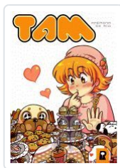
TAM ANEMONA DE RIO