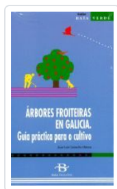
ARBORES FROITEIRAS EN GALICIA (GUIA PRACTICA) CAMACHO LITERAS, J. L.