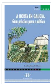
A HORTA EN GALICIA. (GUIA PRACTICA) CAMACHO LITERAS, J. L.