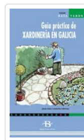
XARDINERIA EN GALICIA. GUIA PRACTICA DE CULTIVO CAMACHO LLITERAS, JUAN LUIS