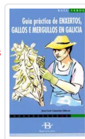
GUIA DE ENXERTOS, GALLOS E MERGULLOS EN GALICIA JUAN LUIS CAMACHO LLITERAS