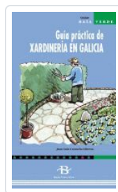
XARDINERIA EN GALICIA. GUIA PRACTICA DE CULTIVO CAMACHO LLITERAS, JUAN LUIS