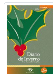
DIARIO DE INVIERNO MARTINEZ OCA, X.M.