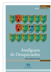
AMALGAMA DE DESQUICIADOS (RELATOS) MARTINEZ PEREIRO, X. L.