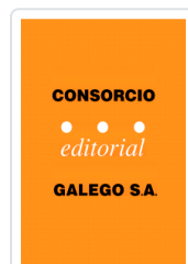
DA ESFINXE (RELATOS) LORENZO GONZALEZ, MANUEL